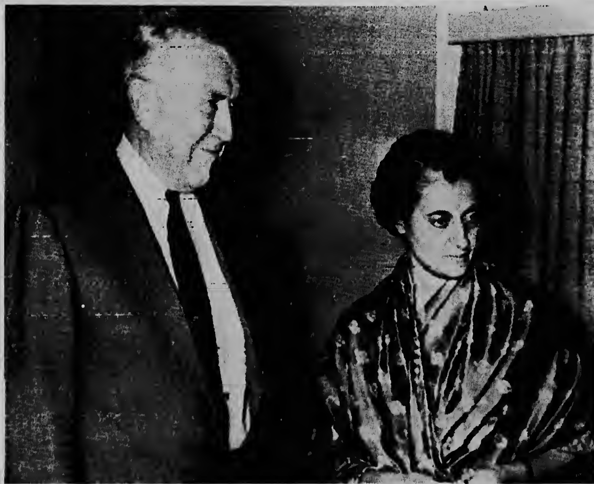
NUEVA DELHI--Sefiora Indira Gandhi, prome minister nobo di India, ta conferencia cu Chester Bowles, embahador norteamericano na India. Bowles a felicita sefiora Gandhi cu su sucesion como prome ministra di India cu tin 480 millon habitante.

E cientificonan, cu ta den constante alerta riba e actividadnan di Etna, a informa cu e lava a cubri casi dos kilometer, pero cu awor e erupcion ta parce di a stop por completo.